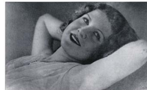
Josefina de la Torre