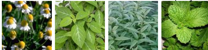
Manzanilla Salvia Hierbaluisa Hierbahuerto

La utilización de las especies vegetales se remonta en el tiempo hasta las tribus prehistóricas. Eran usadas en la antigüedad como aplicaciones mágico-religiosas o como usos terapéuticos o culinarios. Desde entonces, el ser humano y otros seres vivos no han parado de utilizarlas, aunque, en ocasiones, no siempre han sido lo suficientemente valoradas. La evolución, la adaptación al medio natural, el clima, la defensa frente a otros seres vivos, la necesidad de atracción de insectos para la polinización, así como el propio hecho de que otros animales coman sus frutos para la diseminación de sus semillas, entre otras razones, han propiciado en las plantas la creación de miles de colores, variedades, sabores, propiedades, aromas y sustancias que son potencialmente útiles no sólo para ellas, sino también para el ser humano, en su lucha por la preservación de su vida sobre la tierra. De ahí que esta acción natural de las plantas sea, pues, el origen de los múltiples principios activos que podemos encontrar en las plantas medicinales, para su utilización química o de la industria alimentaria o farmacéutica, así como para cualquier otro uso doméstico que ayude al hombre en su vida diaria.